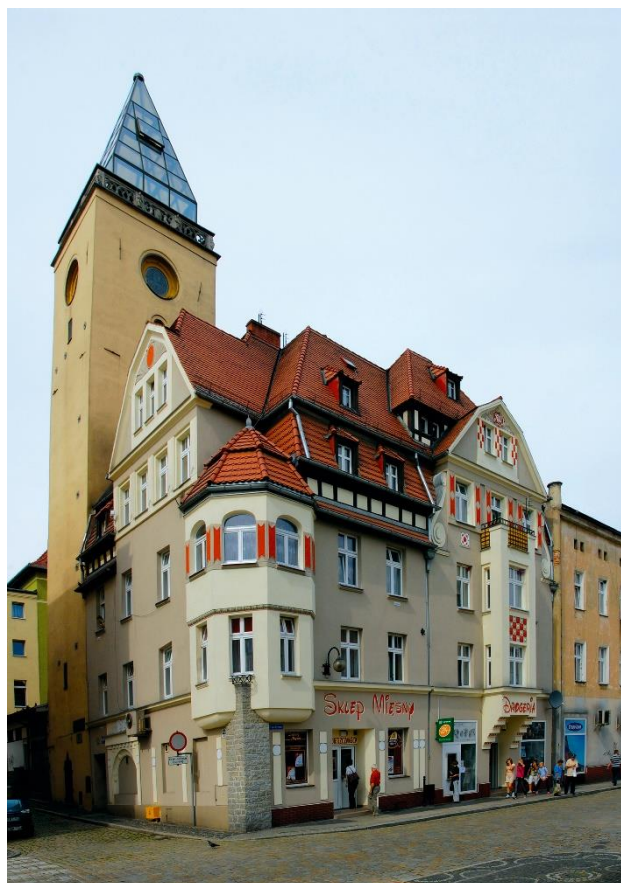
Wieża targowa w Strzegomiu, która już wkrótce przejdzie gruntowny remont i modernizację