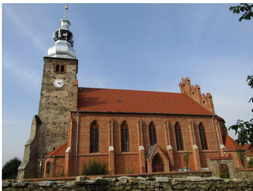
Kościół w Jarosławie z wyremontowaną wieżą (sygnatura) – dzięki pozyskanej dotacji z Rządowego Programu Odbudowy Zabytków