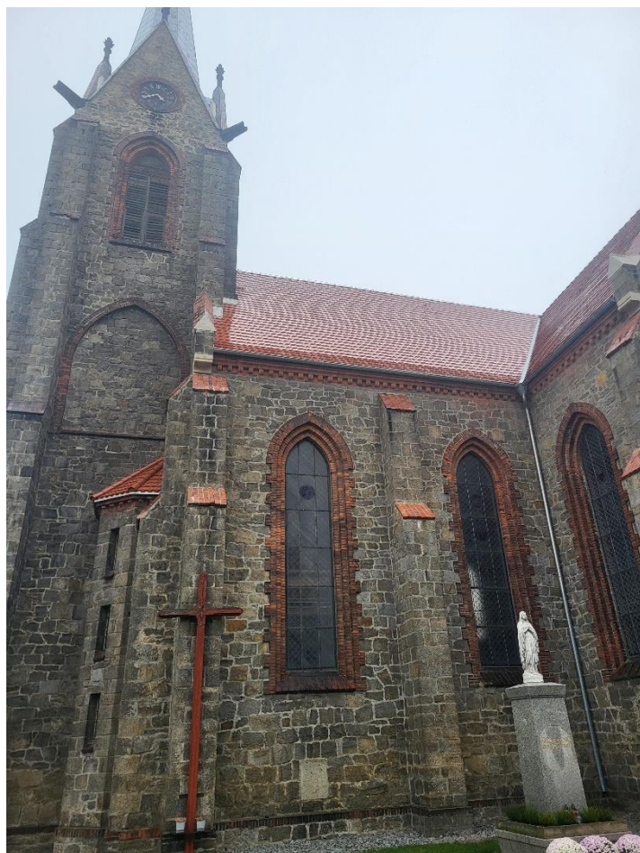
Kościół w Rogoźnicy z wyremontowanym pokryciem dachowym – dzięki pozyskanej dotacji z Rządowego Programu Odbudowy Zabytków