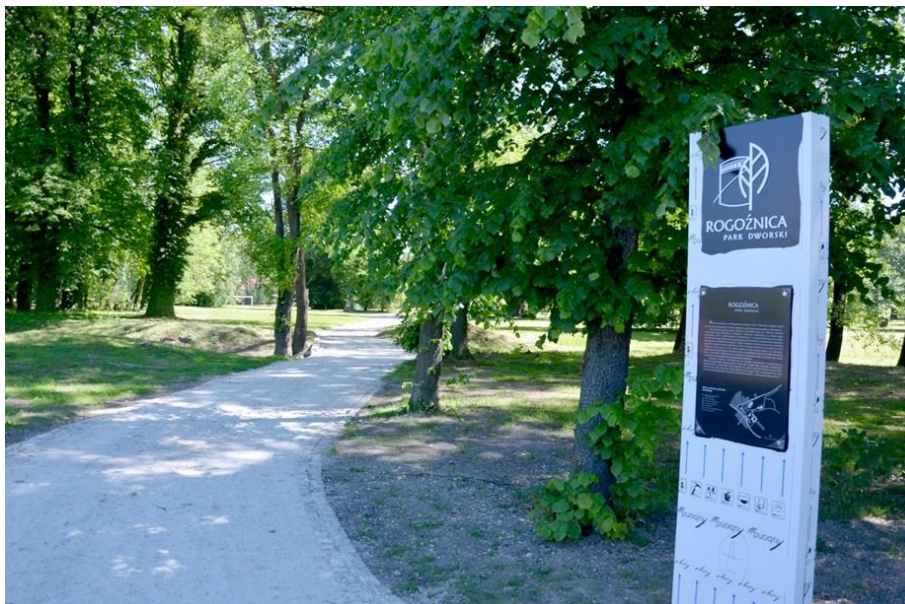
Rewitalizacja dawnego parku dworskiego w Rogoźnicy

Niniejsze sprawozdanie obejmuje okres dwóch lat, tj. od 1 stycznia 2023 r. do 31 grudnia 2024 r. i zawiera ocenę realizacji zadań dla wyznaczonych kierunków działań, zawartych w Gminnym Programie Opieki nad Zabytkami na lata 2023-2026 Gminy Strzegom.